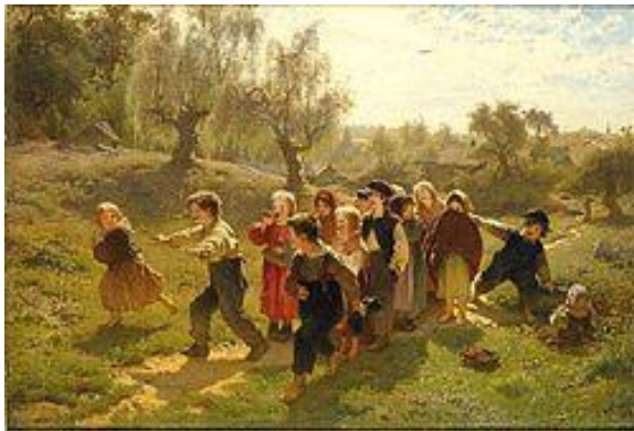
Sista paret ut. Målning av August Malmström.