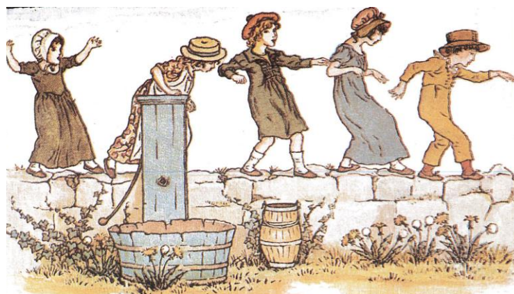
Följa John. Målning av Kate Greenway.

katten med sitt uppdrag blir katten råtta och en ny person blir katt.