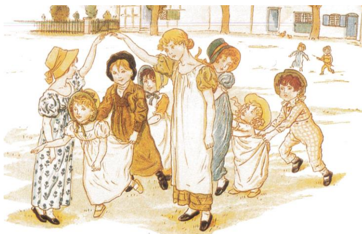
Bro bro breja. Målning av Kate Greenway.