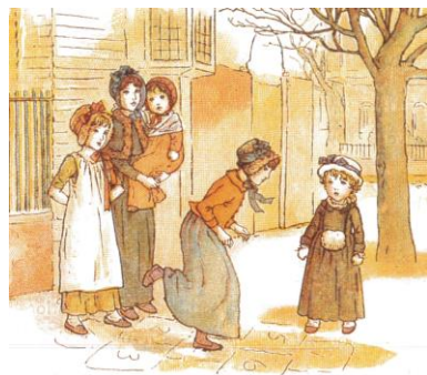
Hoppa hage. Målning av Kate Greenaway.

Hoppa hage är en av de äldsta barnlekarna i Europa. Till de allmänna reglerna hör, att man inte får trampa på linjerna eller sätta ned någon fot i fel ruta. Alla hagar kan hoppas på olika sätt. Det är ni som leker som bestämmer reglerna.